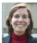
Diana Gibson Parkland Institute, Alberta

Discussion fondée sur les preuves et portant sur la viabilité du régime d'assurance-maladie, les vrais générateurs de coûts, et les résultats « d'expériences » ciblant la prestation privée à but lucratif et la sous-traitance.